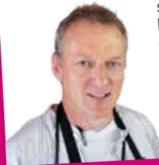
B. Rouxel SCEA Rouxel